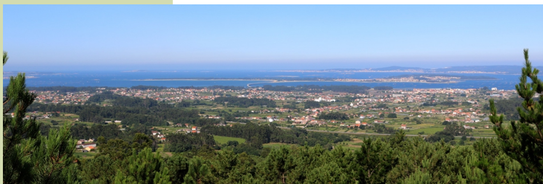
Vista desde o Faro das Lúas: Vilanova da Arousa e Arousa, a illa que lle da nome á ría