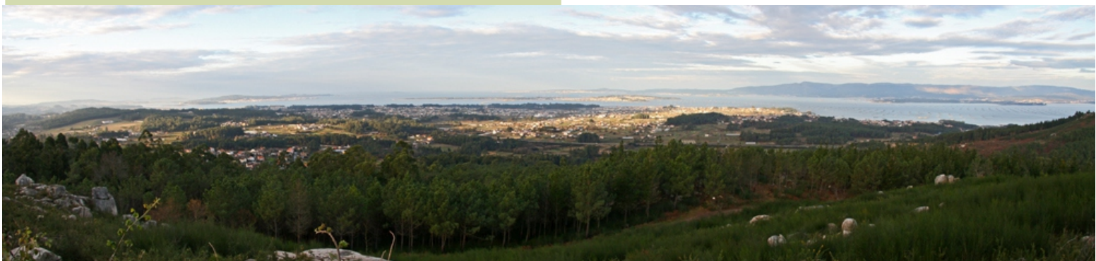
Panorámica desde o Faro das Lúas