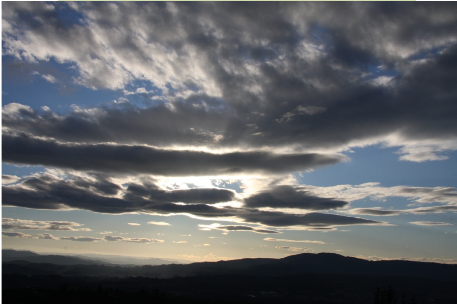
Faro das Lúas: mencer mirando cara ao Castrove e o Val do Salnés