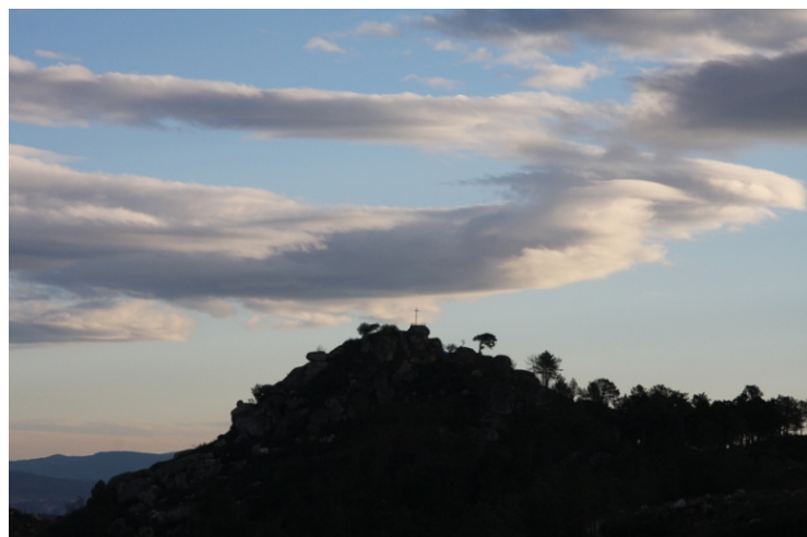
Vista de Lobeira, ao mencer, desde o Faro das Lúas