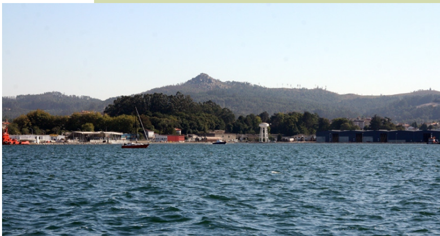
Monte Lobeira desde o mar (á dereita o Faro das Lúas)