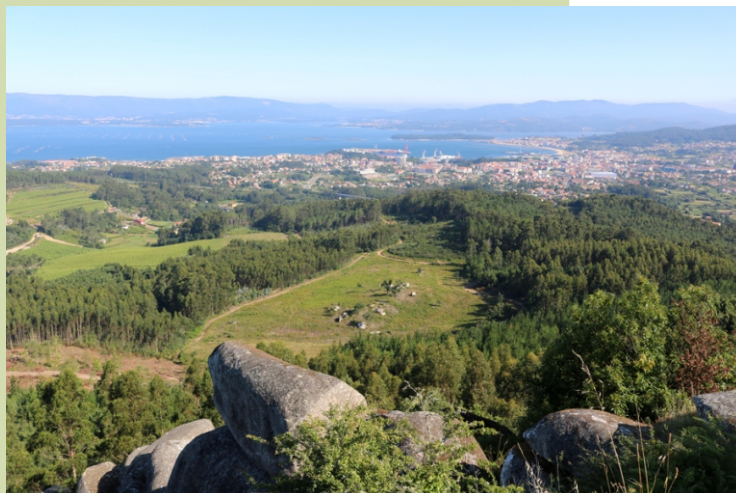
Miradoiro de Lobeira: Vilagarcía da Arousa