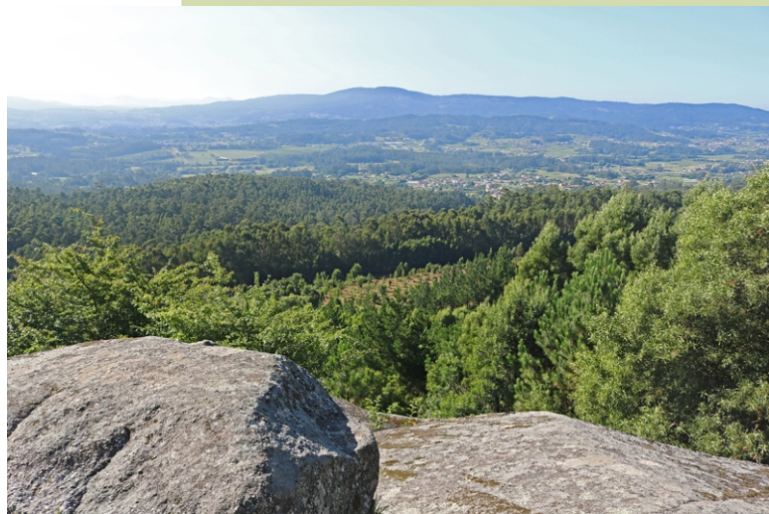
Faro das Lúas: vista cara ao Castrove