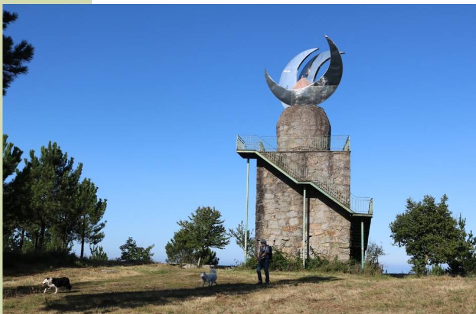
O Faro das Lúas

Aos miradoiros tamén se pode acceder en coche desde a estrada que vai de Vilanova, por András, ao Sixto, pasado András hai un desvío á esquerda, sinalizado, que nos leva, cun curto desvío, ao Faro das Lúas e logo a Lobeira. Desde Vilagarcía, da estrada que vai por Cornazo a Solobeira, sae un ramal, indicado, para subir a Lobeira, desde onde tamén podemos achegarnos ao Faro das Lúas.