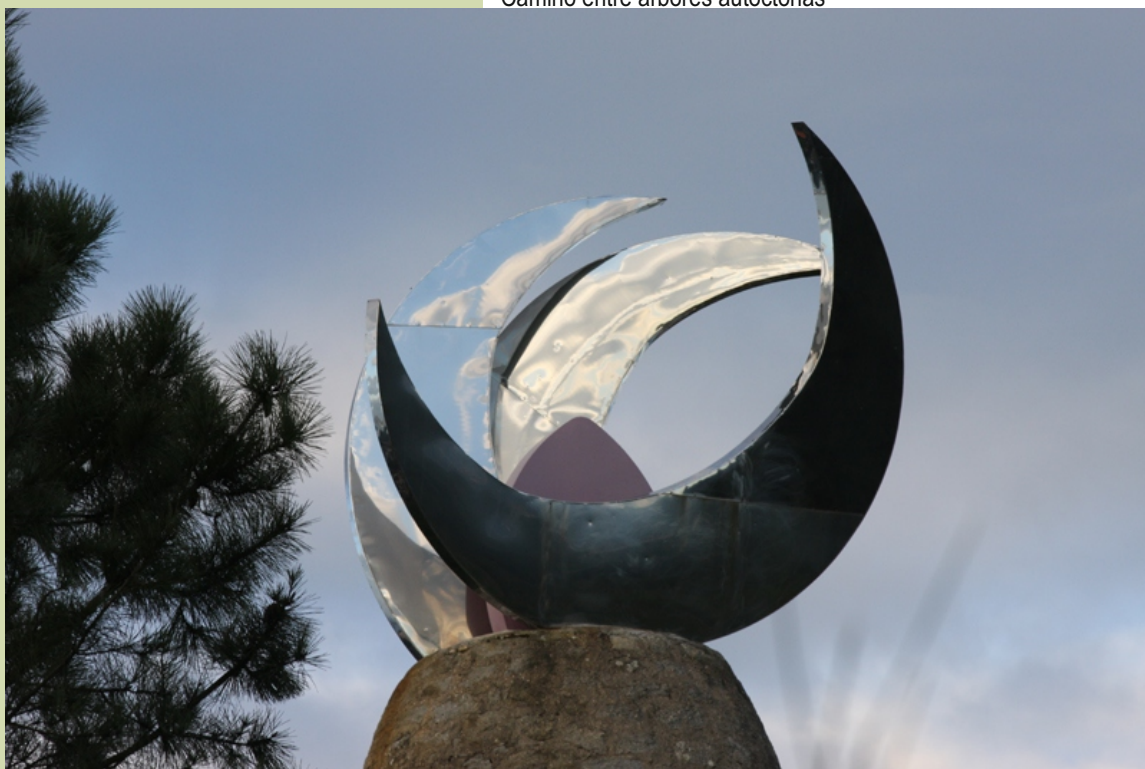
O Faro das Lúas

Desde eles podemos apreciar, cara ao mar, panorámicas de toda a ría de Arousa e máis alá, e cara ao interior, o Val do Salnés, os montes que o limitan, as poboacións que o ocupan e a riqueza agrícola e forestal que encerra.