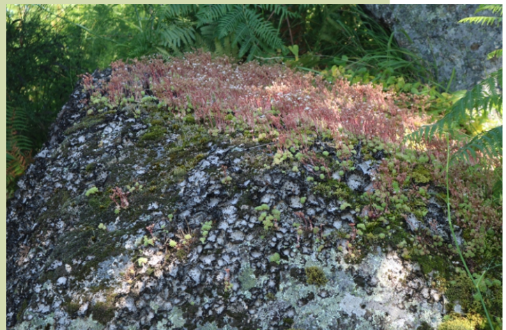
Vida sobre unha rocha: líques, brións, uvas de lagarto...