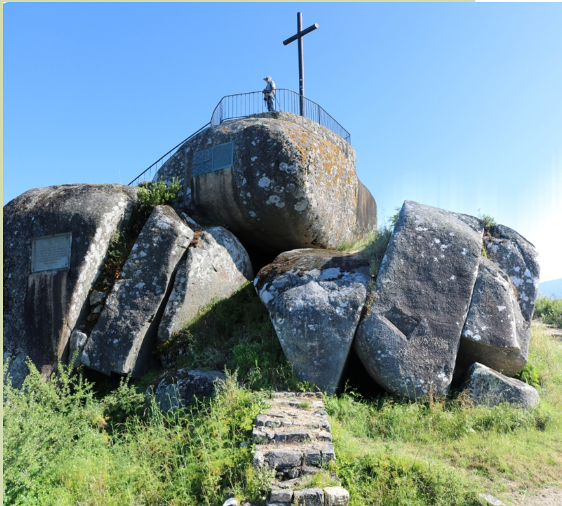
Miradoiro de Lobeira

Unha lenda conta que desde Lobeira parte un túnel que vai ata Vilagarcía.