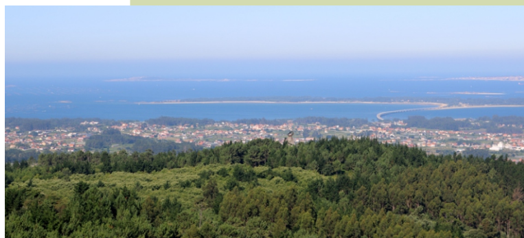
Miradoiro de Lobeira: Illa da Arousa e ría