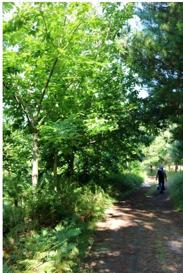
Camiño entre árbores autóctonas

Unha camiñada non moi longa, pero con tramos en pendente, que se fai por pistas asfaltadas e terreñas, para visitar, en András (Vilanova de Arousa), dous miradoiros próximos na distancia mais coas súas particularidades: O Faro das Lúas, de creación recente, que tomou o nome e gañou interese pola colocación no seu cume dunha escultura creada en 2002 polo vilagarcían Manolo Chazo coa que se corou un antigo pedestal dos anos 50 do século pasado que non tiña aproveitamento; e o de Lobeira, o miradoiro tradicional da contorna, un pouco máis elevado, que se asenta nas rochas do cume máis sobresaínte dos arredores, no que en tempos ocupou un castelo do que aínda se poden apreciar algúns restos.