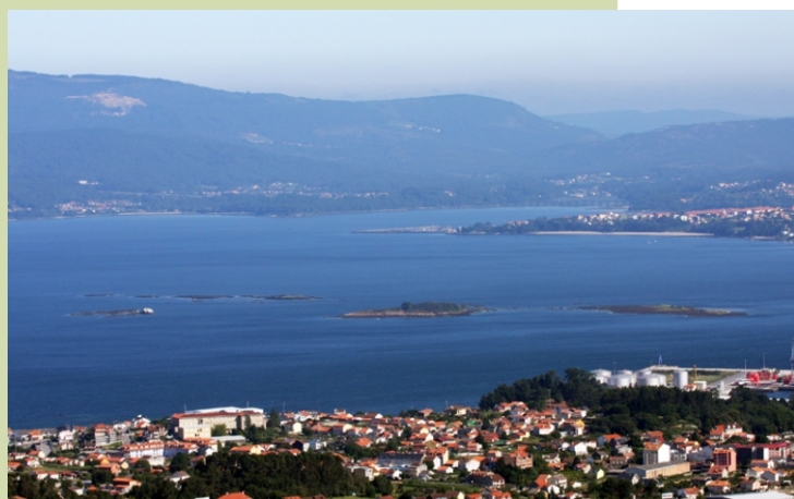
Miradoiro de Lobeira: vista cara ao esteiro do Ulla