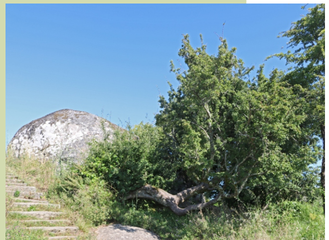
Estripo ( Crataegus monogyna )